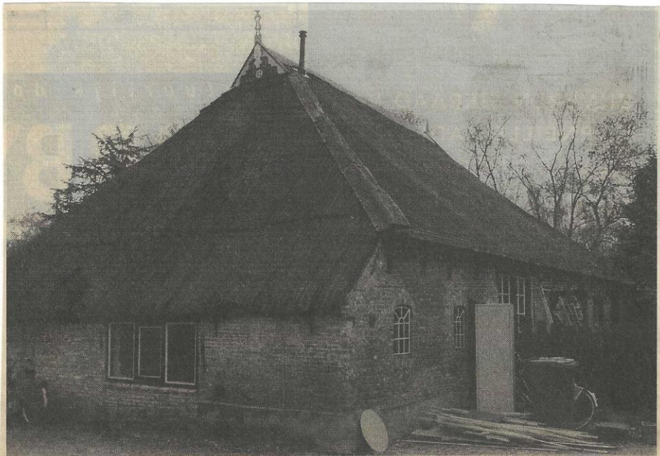
Opname van het pand West 80 te Buitenpost tijdens de sloop in oktober 2002.