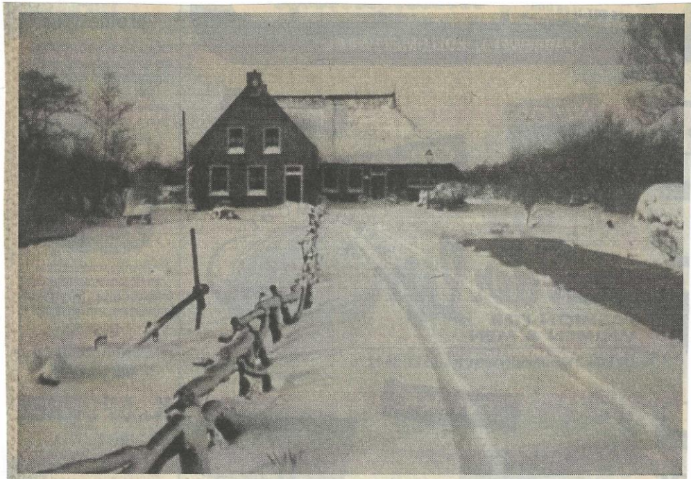
Opname van het pand West 80 te Buitenpost in de winter van 1969.